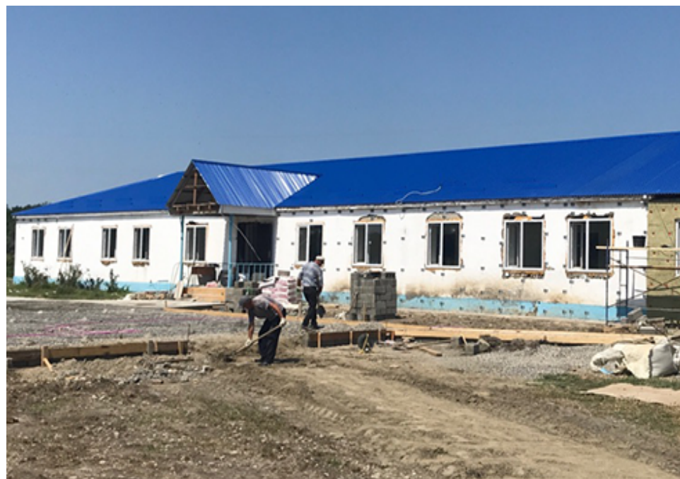
В селении Мацевка на реконструкции местной школы работы не прекращаются и в темное время суток.