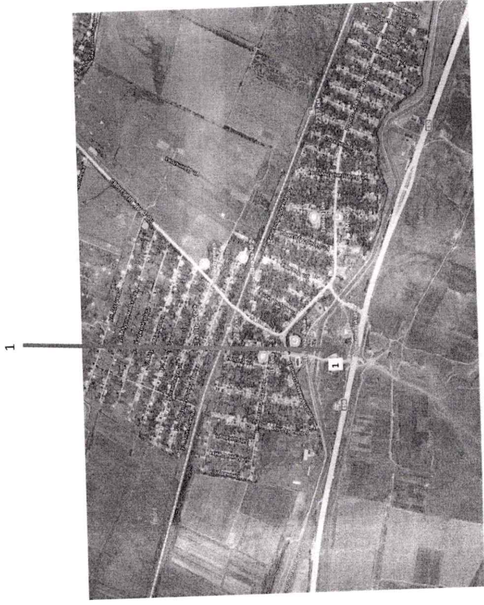
Схема размещения нестационарных торговых объектов на территории МР «Кизилюртовский район» С. Стальское.