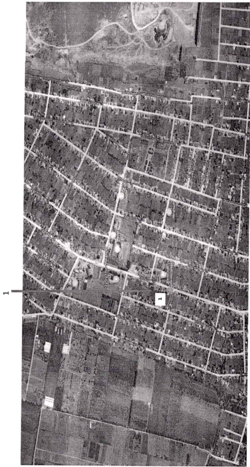
Схема размещения нестационарных торговых объектов на территории МР «Кизилнортовский район» С. Зубутли-Миатли