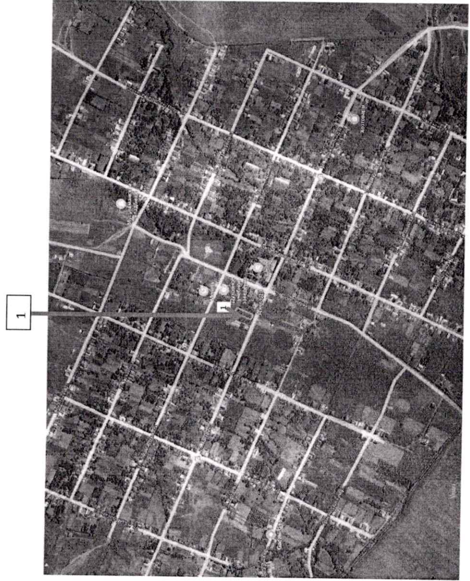
Схема размещения нестационарных торговых объектов на территории МР «Кизилнуртовский район» С. Акнада