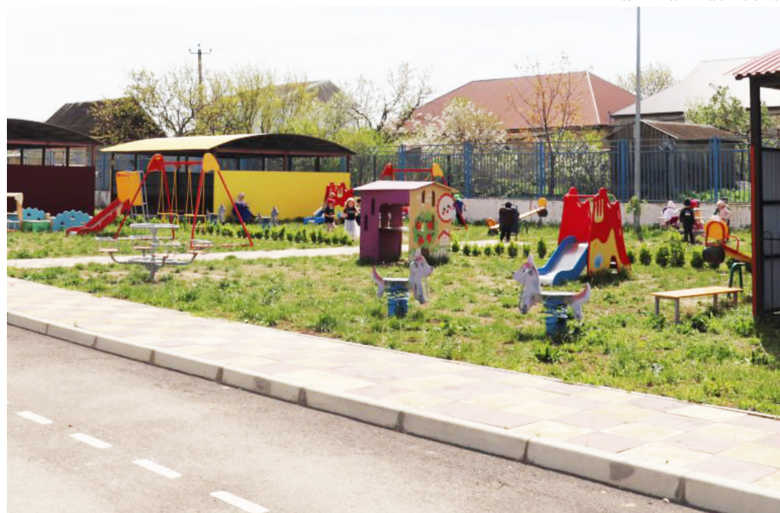
☑ ВСЕ ФОТО МАГОМЕДА МАГОМЕДОВА